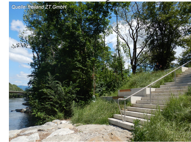
Zugang zum Gewässer