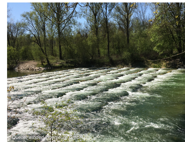
Naturnah gestaltete Rampe