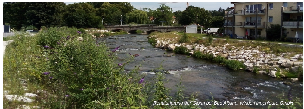
Renaturierung der Glonn bei Bad Aibling, windert ingenieure GmbH

Freuen Sie sich auf ein interessantes Projekt, dass wir gemeinsam erarbeiten wollen und an dessen Ende das „Erleben der Naab“ in Schwandorf stehen wird.