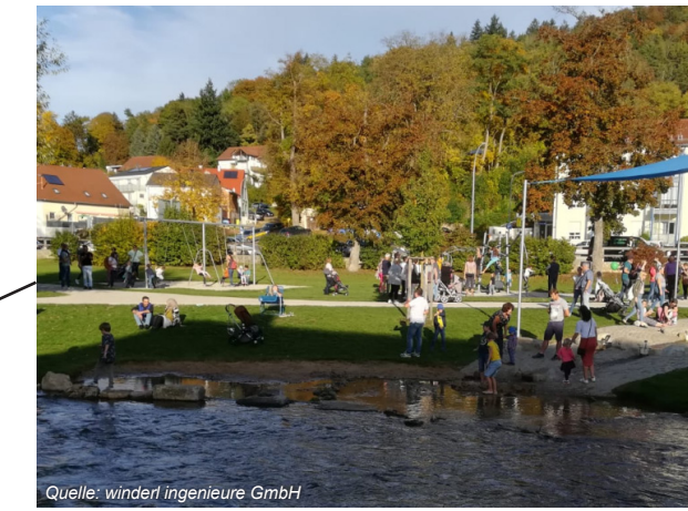
Erlebnis Wasser für Familie