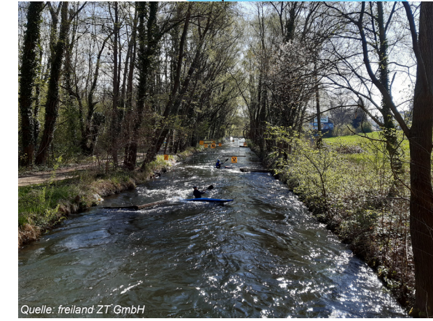
Sportliche Betätigung