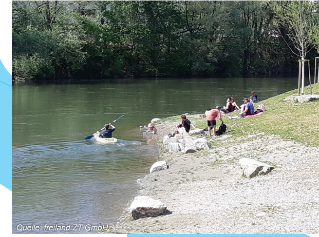
Flache Uferbereiche