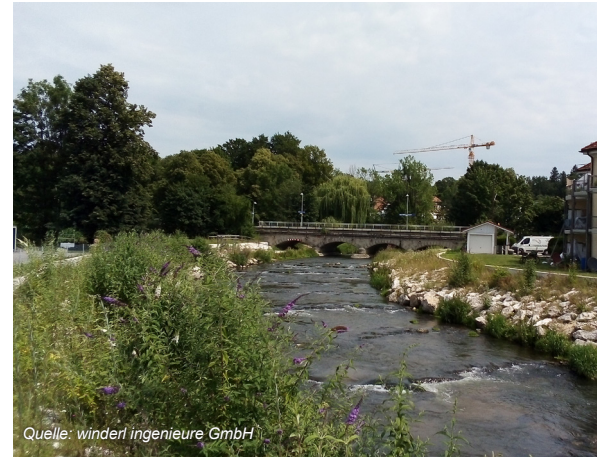
Verbesserte Gewässerstruktur

Derzeit bilden sich aufgrund der Stauwirkung der Wehranlagen und der daraus resultierenden, geringen Strömungsgeschwindigkeiten der Naab Verlandungsbereiche (Ablagerung von flusseigenem Material) mit erheblichem Bewuchs. Die Folge sind Faulprozesse im Sommer und ein für ein Fließgewässer untypischer Charakter.