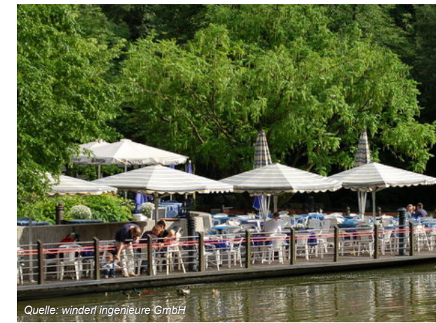
Aufenthaltsbereich am Gewässer